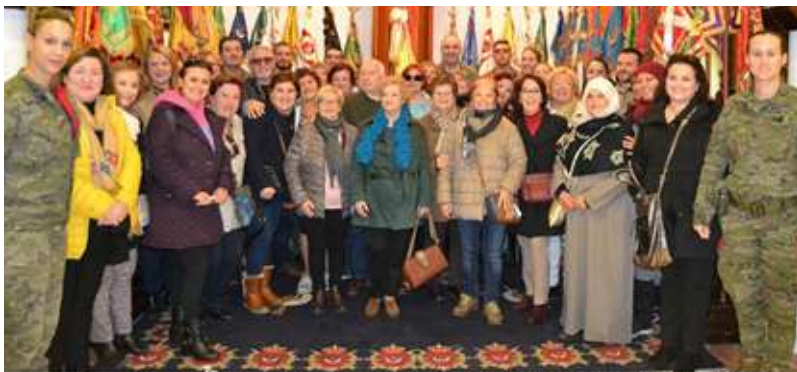
Alumnos de Aulas de Mayores visitando la Sala Histórica del Grupo de "Regulares de Melilla" nº 52

También fuimos informados que las Aulas Culturales para Mayores de Melilla cuenta con un Consejo de Alumnos elegido por los propios alumnos formado por seis miembros, quienes una vez informados mostraron su deseo de seguir perteneciendo a CEATE y de mantener una relación más fluida y directa con nosotros, que estaban dispuestos a pagar la cuota anual fijada en la última Asamblea General como miembro de pleno derecho y que les gustaría recibir la revista digital CEATEnews en las Aulas para que la puedan leer todos los alumnos. ■